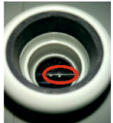
Рисунок 1 - Датчик потока

5. Включить питание извещателя. Если извещатель продолжает сигнализировать о запыленности трубопровода (для ИПА v3 время появления сигнализации о запыленности формируется в течение 30 минут), следует выполнить очистку заборного трубопровода (пункты 6-12). (Для ИПА v4 дополнительно снять заднюю крышку, снять защитный кожух (Рисунок 2) и почистить второй датчик потока.)